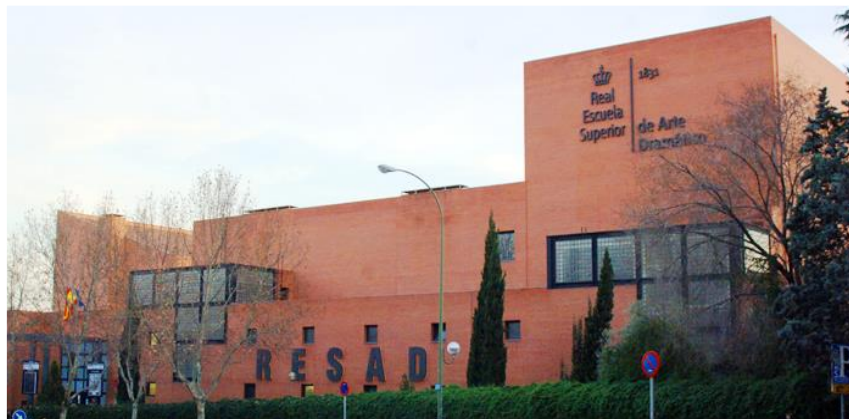
Real Escuela Superior de Arte Dramático, Madrid.

Mayorga ha dirigido el seminario Memoria y pensamiento en el teatro contemporáneo en el Instituto de Filosofía del CSIC y es director de la Cátedra de Artes Escénicas de la Universidad Carlos III de Madrid. Enseñó Matemáticas en institutos, además de haber sido profesor de Dramaturgia durante ocho años en la Real Escuela Superior de Arte Dramático de Madrid, en la que nos recibe con abrumadora generosidad.