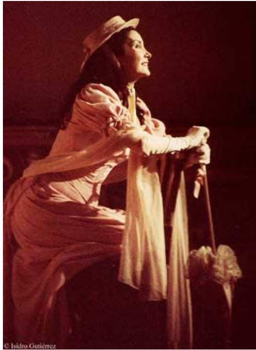
Nuria Espert, como Rosita, en Doña Rosita la Soltera 8 , 1982.

Recuerdo ver a Núria (Espert) saliendo de la sombras, y recuerdo dos sensaciones ante aquel espectáculo: aburrimiento, porque no estaba preparado, pero también fascinación. Y recuerdo que poco a poco he ido sabiendo, me he dado cuenta, de que aquel chaval se estaba encontrando con una representación a través del cuerpo de una actriz nada menos que de las edades de la vida de un ser humano porque eso es lo que se te presenta en Doña Rosita la soltera . Es decir, de algún modo yo estaba siendo expuesto ante el misterio del tiempo, que es el misterio mismo de la vida, el hecho de que tenemos edades. Y sucede además que aquel montaje estaba dirigido por Jorge Lavelli, quien años después dirigiría tres obras más en París, es