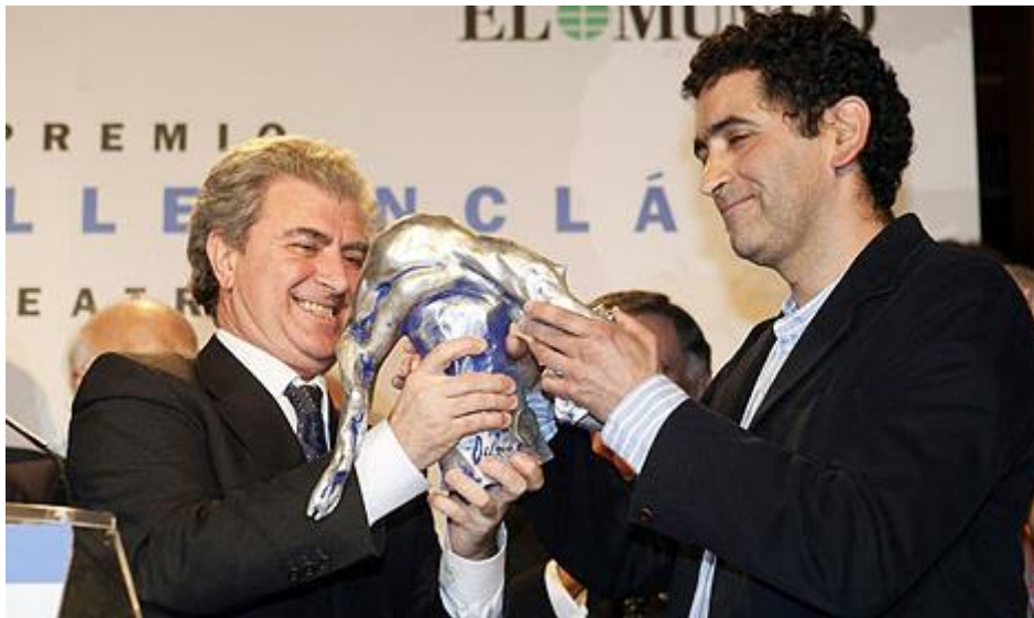
El titular de Cultura entrega el premio a Mayorga.

otro día asistiendo a una lectura dramatizada de La paz perpetua llegué a la conclusión de que tenía que tocar todavía más el monólogo final de esta obra, y lo hice inmediatamente, y ahora va a haber una nueva edición en que aparece ese texto revisado porque sentía que no había defendido lo bastante bien al personaje, porque para mí es fundamental que ese personaje no sea un monstruo respecto del que el espectador inmediatamente se distancie. Y esto también valdría para el comandante Himmelweg o para el Hombre de Animales Nocturnos . Lo útil, lo política y moralmente útil podría ser que el espectador reconociese a esos personajes de algún modo en sí mismos, pero para que eso ocurra yo tengo también que sentir que esos personajes son parte de mí, es decir yo tengo que descubrir en qué medida también el comandante, Stalin o el Hombre Bajo son parte de mí.