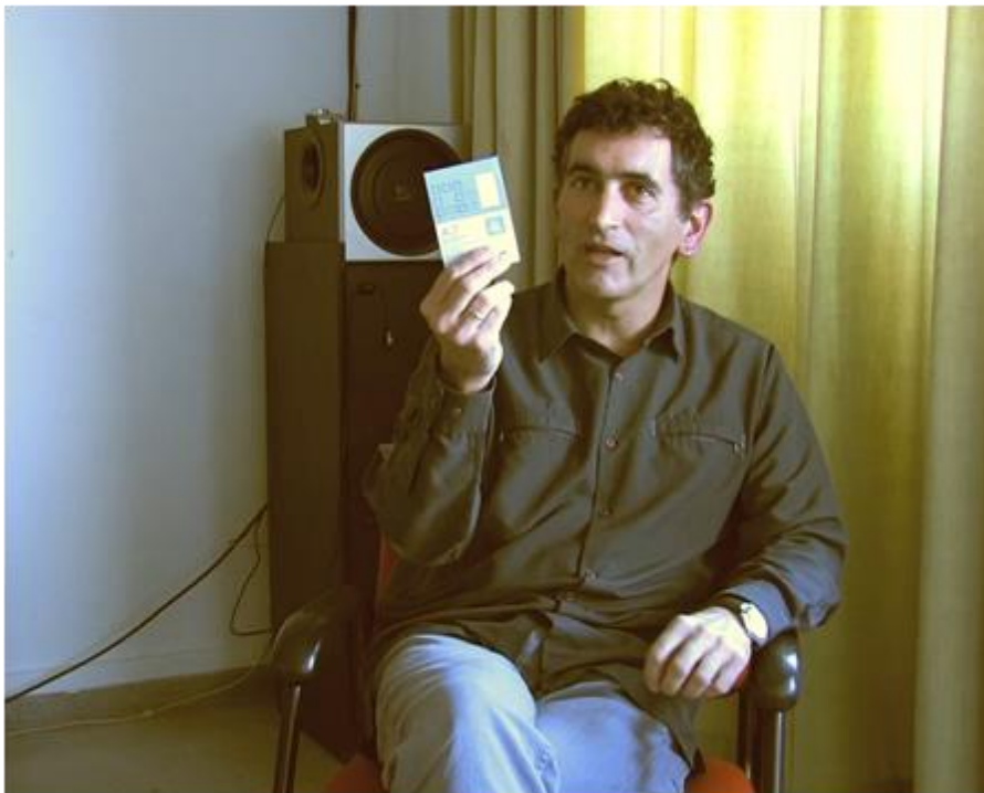
Fotograma de video de entrevista realizada por Beatriz Velilla. 2016, RESAD (Madrid).

O surge de una foto. Así surgió La tortuga de Darwin . Yo vi en el periódico La Vanguardia una foto en la que veía a dos tipos a los que caracterizaba el pie de foto como cuidadores de animales en el zoo de Sídney (Australia), y ponía «Harriet cumple 175 años». Ahí me entero de que Darwin se trajo de las Galápagos cuatro tortugas gigantes, una de las cuales supuestamente todavía vivía en Sídney después de no haberse aclimatado a Londres o a las Islas Británicas. Y pensé «¡qué interesante!: un personaje que ha visto, o que ha tenido noticia de ello, de la Revolución de Octubre y la Perestroika», y así surgió La tortuga de Darwin , de estas libretitas.