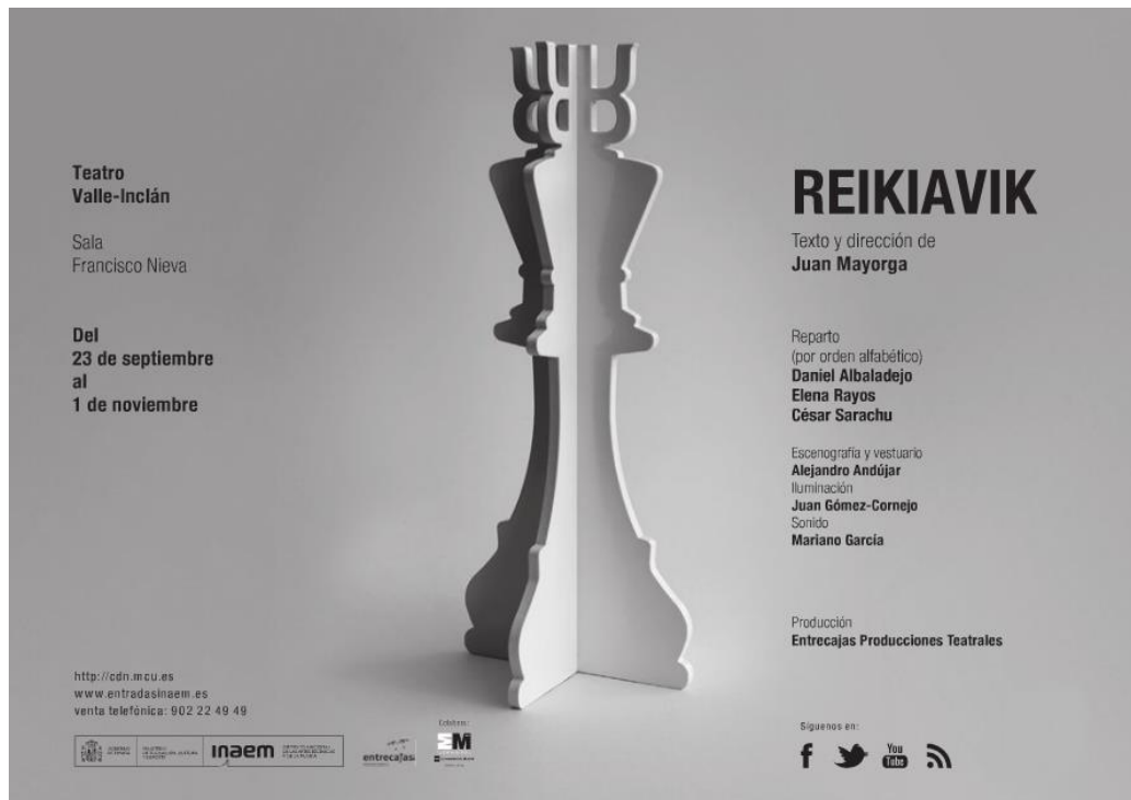
Cartel de Reikiavik en el Teatro Valle-Inclán, CDN. Madrid, 2015.

«La Loca de la Casa» es la compañía que fundaste en 2011 para, un año después, hacer el montaje de La lengua en pedazos 15 . ¿De dónde surge el nombre de «La Loca de la casa»?